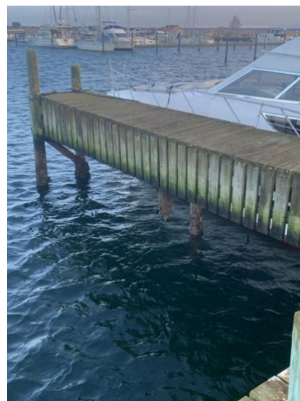
Under brohovedet på bro 2 hang flere pæle uden forbindelse til bunden. De er nu skiftet

Det kan betyde, at vi kommer til at gøre en ekstra indsats i forhold til at undgå tæring. Vi har derfor været i kontakt med en leverandør af løsninger for offeranoder, der kan hjælpe med at sikre pælene godt, vedligeholdelsesvenligt og ikke for dyrt.